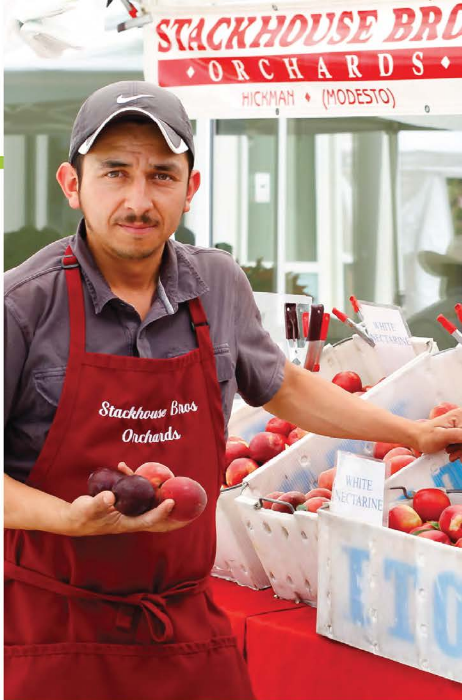
El mercado de agricultores de Natividad se caracteriza por tener granjas familiares, y el producto se cultiva a menos de 100 millas de la Costa Central.