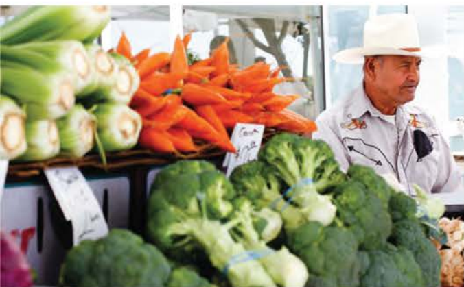
El mercado de Every's Harvest comparte el lema inspiring healthy lives (inspirando vidas saludables).

Lo especial del mercado de Natividad es que el hospital tiene una visión compartida con el mercado: mejorar la calidad de los alimentos de cultivo local disponibles para la comunidad.