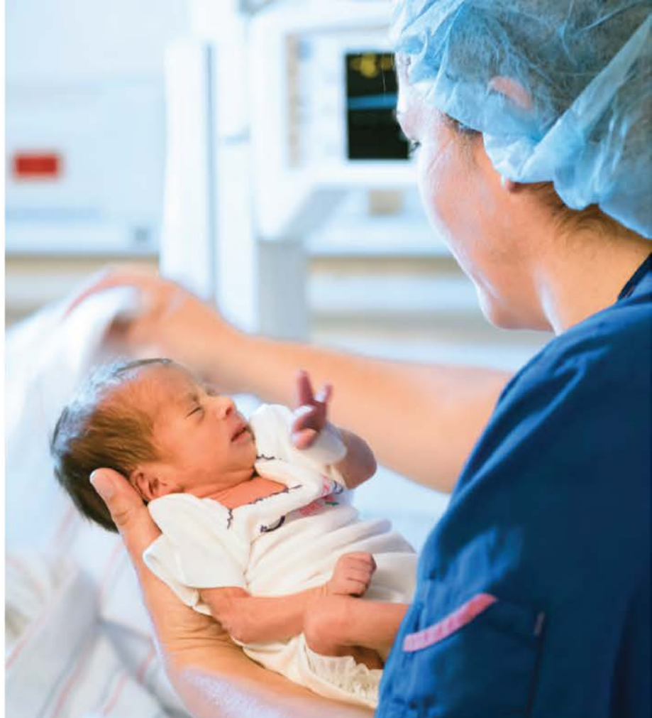
Los bebés que necesitan cuidados especiales pueden recibirlos en la Unidad de Cuidados Intensivos Neonatales (NICU, por sus siglas en inglés) de Natividad.